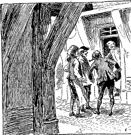
Ο Ζιροφλέ εκπροσιπείτο τούς πελάτας του (Σελ. 293, στ. γ')

Άλλά, πόν αναχώρησιν διά την Άγγλίαν, ο μικρός Μπόμπης, ζητών εις τόν Μαθρον Πύργον τόν πρώην κύριόν του λόρδον Πέρον, μανθάνει τυχαίως, τώ μυστικόν του ιδιοκτήτου τού πάργου, τώ καλού κόμητος Μουσύ, ο όποιος έκρατούσεν εκεί φυλακισμένον ένα γέροντα θεϊόν του, διά να σφετερισθώ την περιουσίαν του. Ο Μουσύ άντός φυλακίζεται και τόν Μπόμπην εις τώ υπόγειον τού