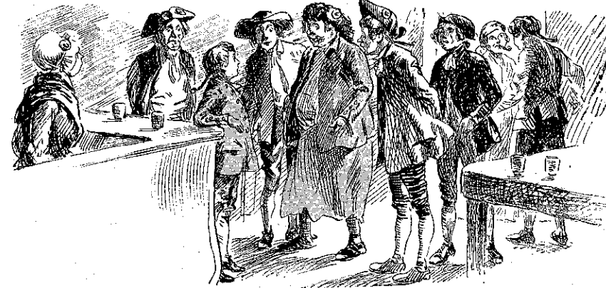
Έξήσκει τό επάγγελμα του πρώην φυλακισμένου... (Σελ. 294, στ. α')

ΤΙΜΗ ΕΚΑΣΤΟΥ ΦΥΛΛΟΥ Λ. 20 Διά τών Πρακτόρων, Έσωτερ. λ. 10. Έξωτερ. λ. 15 Φύλλα προηγούμενων ετών, Α' και Β' περιόδου τιμώνται έκαστον λεπ. 25 ΓΡΑΦΕΙΟΝ ΕΝ ΑΘΗΝΑΙΣ Όδός Έδριπίδου άρ. 38, παρά τώ Βαρβάκειον Έτος 35ον.—Άριθ. 37