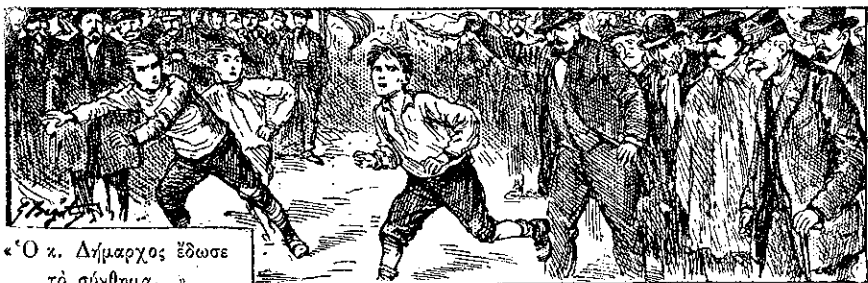
«Ο κ. Δημαρχος έδωσε το σύνθημα...»

— Έ! έ! πού τρέχεις έτσι, μικρέ; τον ήρώτησεν ένας ύπάλληλος.